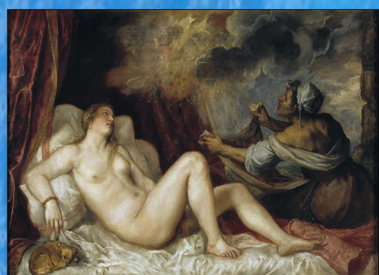
Dánae recibiendo la lluvia de oro (1565)