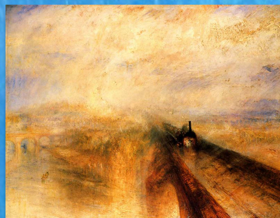
Lluvia, vapor y velocidad (1844)